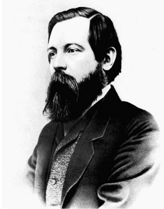
ဖရက်ဒရစ် အိန်ဂယ်