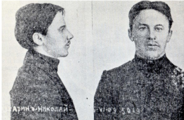
8. 1909 : Photo d'identité judiciaire de Boukharine après sa première arrestation par la police tsariste.