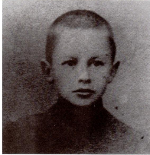
1. Vers 1897 ou avant ? : Nicolas Boukharine écolier