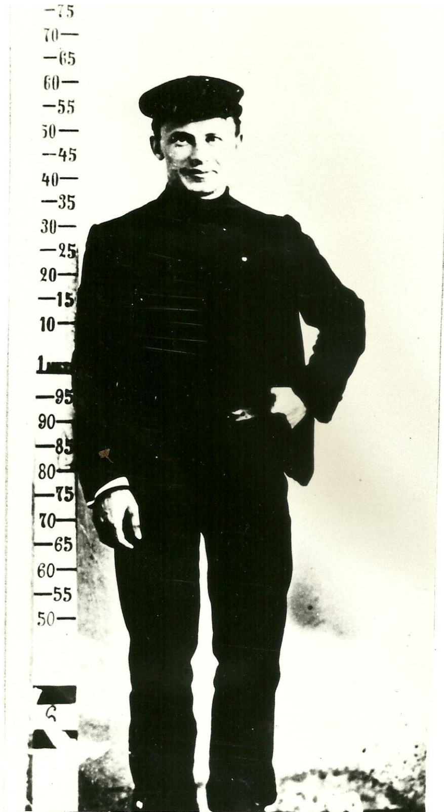
7. Photo d'identité judiciaire (taille 1 m 60, avec une casquette ?)1909