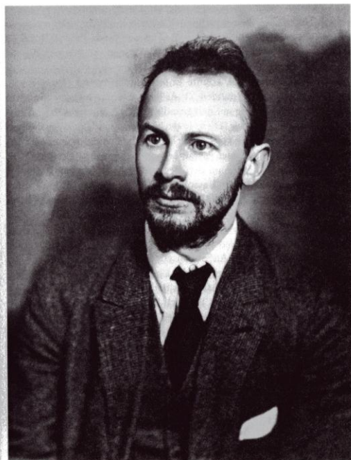
Nikolai Bucharin in Wien (1912)