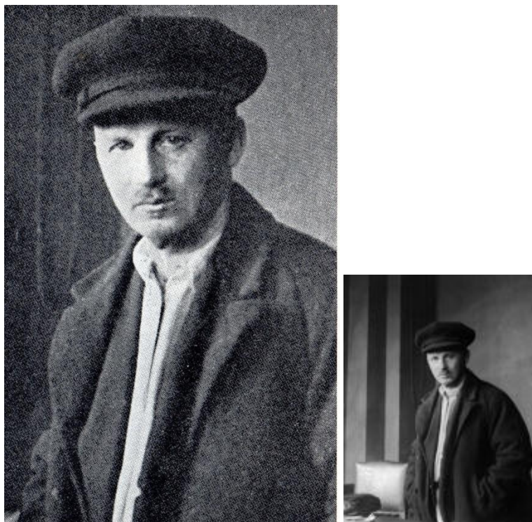
14. 1917 (deux cadrages)