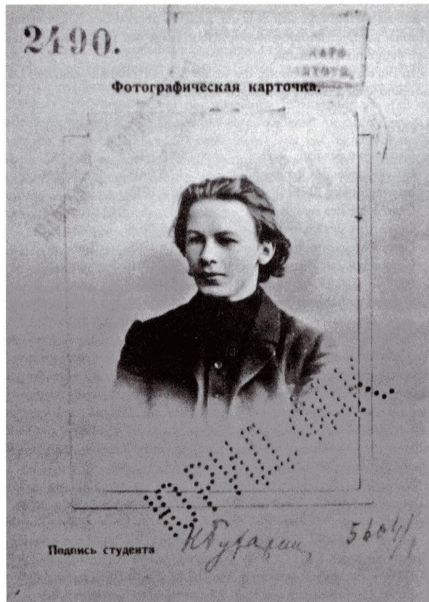
Nikolai Bucharin als Student der Juristischen Fakultät der Moskauer Universität, Seite aus dem am 3. April 1908 ausgestellten Studienbuch

5. La mère de N. I. Boukharine (non daté)