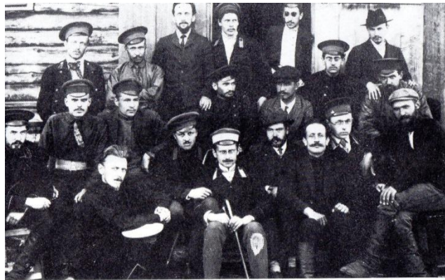
9. 1911 : Dans la région d'Arkhangelsk, un groupe de révolutionnaires déportés. Boukharine est au troisième rang à droite avec un chapeau.