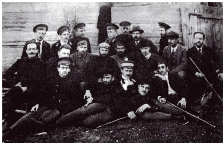
Verbannte in Onega 1911, Bucharin in der 2. Reihe, 3. von rechts