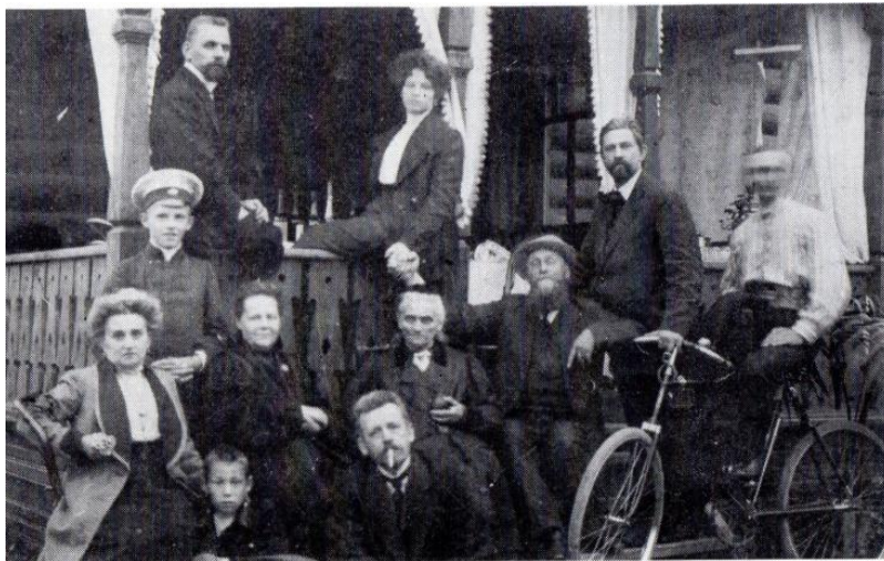
4. La famille de Boukharine. Au centre, sa mère, sa grand-mère et son père (non daté)