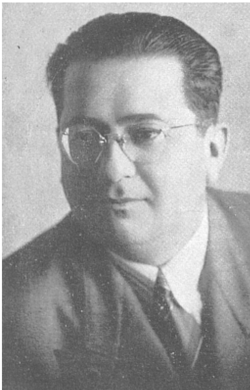
Arthur Ramos (1903-1949)

escravismo na formação da colônia, inclusive com desenvolvimentos fundamentais em termos do que é a sociabilidade, a cultura e o contraponto escravo-senhora. Esta questão pode ser encontrada parcialmente está em trabalhos de Roger Bastide e de forma mais elaborada em textos de Florestan Fernandes.