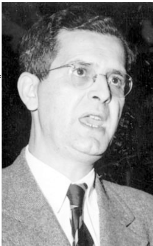
Caio Prado Júnior (1907-1990)

Coloco a seguinte interrogação: como é possível afirmar e reafirmar a democracia racial num país em que as experiências de democracia política são precárias e que a democracia social, se existe, é incipiente? Isso é minimamente uma contradição, um paradoxo num país oriundo da escravatura, autocrático, com ciclos de autoritarismos muito acentuados.