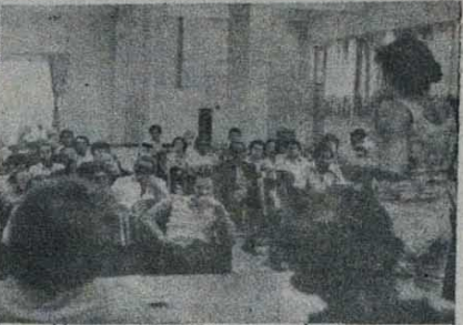
Assembléia no ABC. Começou a luta.

Os Sindicatos de Santo André, São Bernardo e São Caetano já resolveram: Assembléia no ABC. Começou a luta. farão como no ano passado, unindo-se entre si e não se amarrando à Federação.