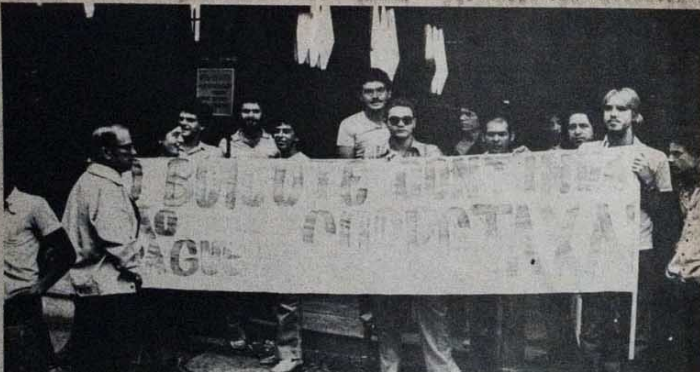
Para a sobretaxa cobrada pela PUC, uma resposta: boicote estudantil.

E mais um passo dado para trás no já precário ensino mato-grossense. (J.B.C.S., Cuiabá, MT)