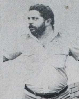
Luis Inácio da Silva, Lula