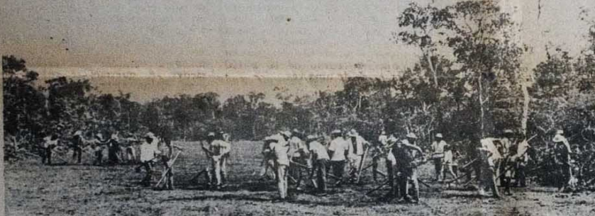
O mutirão, tradicional sistema de auxílio entre os camponeses, virou forma de enfrentar grilagem.

Só se deve entrar em greve com apoio expressivo da categoria. Neste ponto, João Paulo criticou tanto as greves deflagradas sem certeza da vitória quanto as direções que "não são corajosas na mobilização e se prostram". E neste ponto ele pode falar de cadeira. Seu sindicato dirigiu uma das greves mais coesas dos últimos tempos, em outubro passado. Nem foi preciso piquete. A paralização foi total.