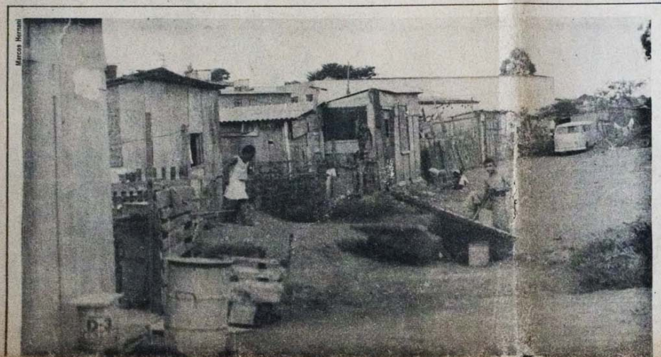
Como esta, há 946 favelas em São Paulo. O número de favelados cresce 33% ao ano.