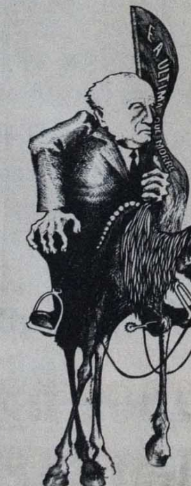
O "cavaleiro da esperança" gosta de ser chamado "arenite de Moscou".

Se é assim, surge logo a questão: os povos são capazes de defender a si próprios? ou precisam ser "ajudados" pelas estratégias de potências estrangeiras? Isto porque, afinal, as agressões imperialistas sempre foram feitas em nome da "ajuda" aos povos oprimidos, com a desculpa de que eles não tinham condições de decidir sobre seu destino.