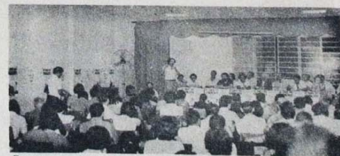
Encontro sindical: mais unidade.