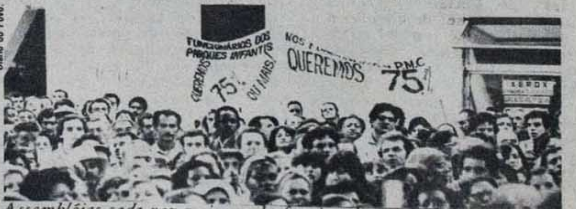
Assembléias cada vez maiores do funcionalismo (foto de exploração).

A polêmica se desenvolve também no ABC. E isto dá uma importância ainda maior à luta que se iniciou. A campanha passa a ser encerrada como um teste, na prática, das duas posições em conflito: a que quer empurrar o movimento operário para frente e a que procura segurá-lo. Dentro de algum tempo, os olhos de toda a classe e de todos os explorados do país vão estar voltados para o ABC, e isto dá um exemplo. Os metalúrgicos em campanha sabem disso. E estão se esforçando para ninar a camisa: parar, ganhar e levar. (Bernardo Joffily)