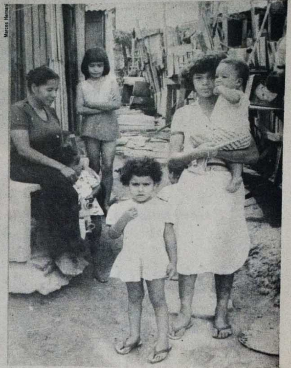
A mulher suporta em dobro os problemas do povo brasileiro.

Para isso, é importante que, desde já, a mulher se organize também em torno das questões que estão diretamente relacionadas com a sua emancipação. Na prática, a mulher já tem procurado construir essas organizações, como a Sociedade Brasil Mulher, Associação das Mulheres, Nós Mulheres, clubes de mães, etc.