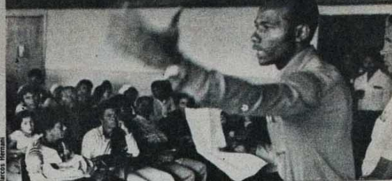
Reunião em São Miguel: 19 favelas se unem para lutar.

ta às pressões dos favelados, a prefeitura de São Paulo anunciou um projeto de melhorias das favelas. Prevê a instalação de água, luz, melhorias nos barracos, esgotos, escoamento e limpeza dos córregos, creches, arruamentos etc. O plano parecia excelente mas na prática não era bem assim. Propunha a instalação de um medidor de água (cavelete) para cada 20 barracos; a mesma coisa com a luz, ou seja, um relógio para cada 12 barracos. Com isso, uma família teria de ficar responsável por tudo e ainda responsável por dividir as contas entre os moradores, o que, em experiências anteriores, tem resultado em desentendimentos.