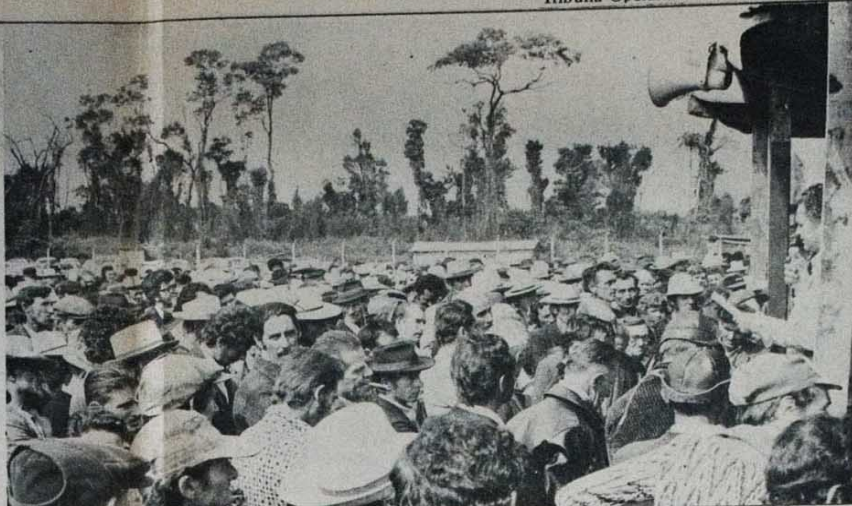
Um fato novo na vida do bóia-fria paranaense: a campanha salarial para defender seus direitos.

seguro dos trabalhadores, proibindo-se o transporte de ferramentas junto;