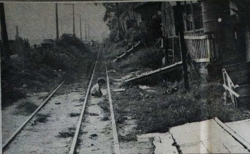
Brincando na linha do trem, o filho de um operário da Shara, filho também da favela.