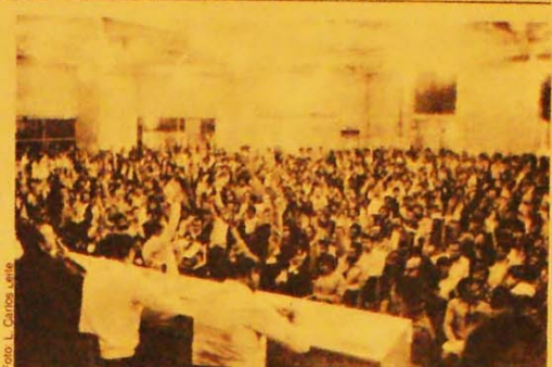
A assembleia aprova a pauta de reivindicações dos metalúrgicos.