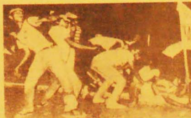
Populares apedrejam o palácio do governo

Eles são 240 mil em Pernambuco e 30 mil no Rio Grande do Norte. Na campanha salarial, proclamam que "o tempo da escravidão já acabou". Pág. 8