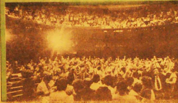
A pressão dos sindicalistas nas galerias foi decisiva para a derrota do 2.024

Por 252 votos contra um, o governo Figueiredo e o FMI morderam o pó da derrota quarta-feira no Congresso Nacional. Seu decreto de redução dos salários, o 2.024, foi derubado pelas oposições unidas. Agora prepara-se a batalha contra o outro decreto da fome, o 2.045, em que a pressão do movimento sindical e popular será decisiva. Página 3