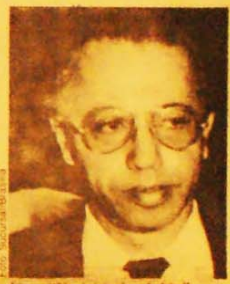
Lima: "Um início de rebelião"