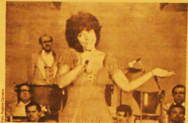
Nara Leão, musa da bossa nova e papel destacado na música popular.