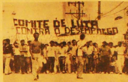
Passeatas, comitês, greves. Engrossa a luta contra o desemprego.

A nova Carta de Intenções junto ao FMI foi assinada pelo governo Figueiredo. Condena o povo brasileiro a uma escalada do desemprego e de submissão. As ordens dos banqueiros internacionais são duras: cortes nos salários, nas importações e nas despesas públicas. A tática é clara: enfraquecer para dominar.