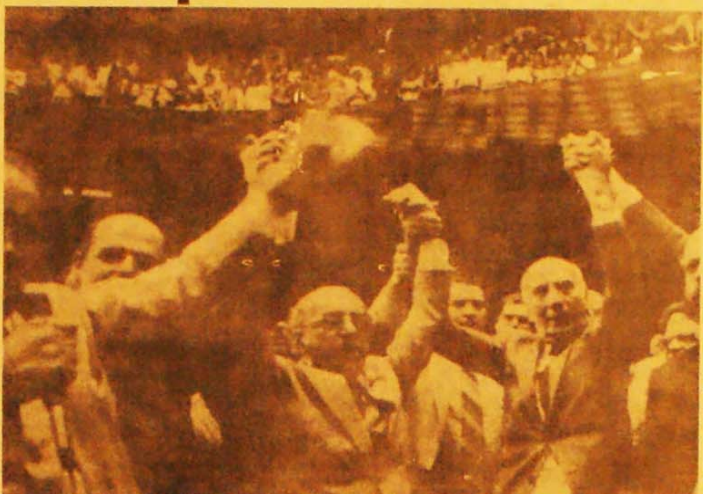
Freitas Nobre, ao lado de Ulisses Guimarães, comemora a vitória. "Um grito em defesa da pátria ameaçada"

Para compensar estas ausências, 11 deputados pedessistas rebelaram-se contra os ordens do Palácio do Planalto e votaram contra o decreto, junto com as