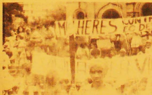
Mulheres e crianças na manifestação contra o aumento do leite, em Belo Horizonte.