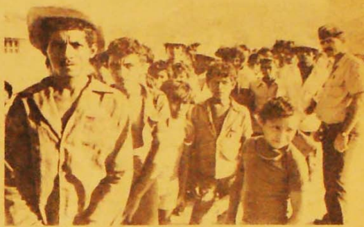
O símbolo da campanha da Globo oculta a preocupação consciente e premeditada de não deixar o povo do Nordeste e do Brasil se dar conta da raiz do problema

Com sua técnica sofisticadíssima, a TV Globo tentou, dia 18, superar a si mesma e conseguir o impossível: fazer do drama dos sertanejos nordestinos um espetáculo global. Porém diferentes personalidades pernambucanas, ouvidas pela Tribuna Operária, têm sérias críticas a uma coleta de donativos que não resolverá.