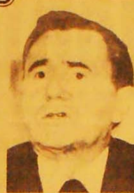
Gromiko não compareceu à Assembleia da ONU.

Acentuando que os governos componentes do "Grupo de Contadores" têm diferenças táticas com Washington em relação à melhor maneira de deter a revolução na região. Eles consideram o curso de Reagan, de buscar uma vitória militar a qualquer custo, uma alternativa suicida que só agravará a tensão revolucionária, até mesmo nos seus próprios países. Por isso se esforçam por estrair a luta dos povos com propostas de conciliação. No caso da defesa da Nicarágua Sandinista, as diferenças podem ser exploradas ao máximo para deter a invasão ianque. Mas em El Salvador os esforços do Contador se voltam fundamentalmente para deter o ascenso da luta revolucionária e patriótica.