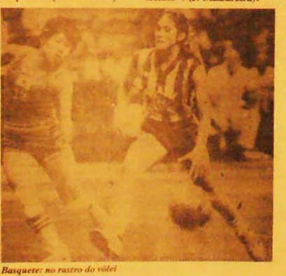
Basquete: no rastro do vôlei