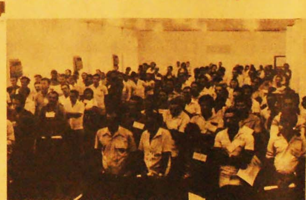
Grande número de trabalhadores rurais participou do Encontro da Tendência Popular.