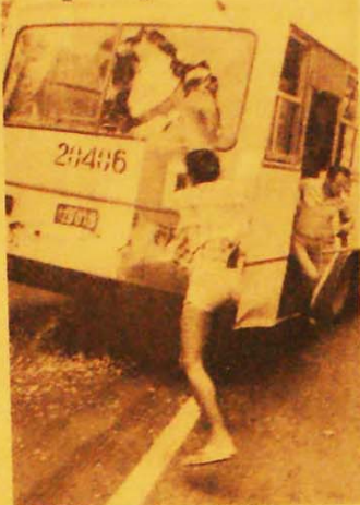
Cerca de 100 ônibus foram depredados

Mas na quinta-feira o governador Gilberto Mestrinho, ao invés de tratar dos problemas do povo, acusou o Partido Comunista do Brasil como causador dos conflitos. Numa cadeia de rádio e televisão do Estado, adotou uma atitude policiaesca e passou inclusive a citar os nomes de pessoas supostamente da direção deste Partido. É uma velha manobra, muito usada pela ditadura — não tem soluções para a crise e trata de apontar um bode espiatório para desviar a atenção. Mestrinho chegou mesmo a atacar o deputado estadual do PMDB João Pedro.