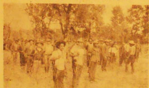
Os guerrilheiros da FMLN estão desmoralizando o exército salvadoreño.

Tentando salvar seus lacaios em El Salvador, o presidente Ronald Reagan ludibriou mais uma vez as limitações impostas pelo congresso norte-americano e aumentou o número de assessores militares para as forças armadas salvadoreñas. Com simples mudanças formais de cargos, Reagan aumentou o pessoal lotado na embaixada de seis para 11 militares e o total de assessores abertos de 55 para 61. Mas as recentes vitórias da FMLN revelam que as tropas norte-americanas vão ter de se envolver muito mais diretamente nos combates para deter ou retardar a maré revolucionária salvadoreña. E aqui a síndrome do sofrimento de um novo Vietnã se faz sentir mais do que nunca na população dos Estados Unidos.