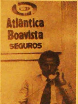
Bernard, de repente, um ídolo

Por mais que isto desagrade os patriarcas desses esportes e "profiteiros" esportivo" (J. Madureira).