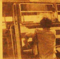
Ônibus depredado em Goiânia.

O governador também contribuiu para a explosão popular, ao autorizar a polícia a proibir a manifestação. Gilberto Mestrinho tem tido uma atitude lamentável no trato das questões com o povo. Um exemplo é sua atuação nas invasões de terra. Ao invés de alajar os migrantes nas imensas áreas vazias ao redor de