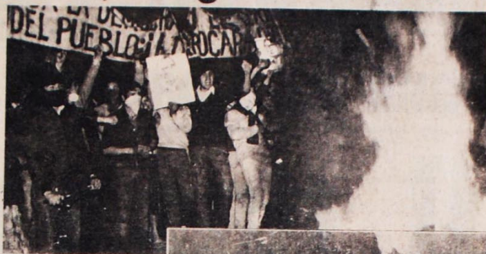
No Chile e no Uruguai, manifestações em que milhares de populares exigem o fim das ditaduras militares.

EXITOS NA ARGENTINA Na Argentina, a luta democrática obteve maiores êxitos, a ponto de derrocar os generais. Para isto, além da guerra econômica, pesou a derrota vergonhosa que o regime sofreu na guerra das Malvinas. Multiplicaram-se as manifestações de protestos durante o segundo semestre de 1982, contra a ditadura desmoralizada. A greve geral de 16 de dezembro de 1982 foi o ponto de virada para a torrente popular que sacudiu a Argentina em 1983. A adesão de 96% dos trabalhadores deixou claro que os generais, de fato, já não mandavam mais na Nação. Em 28 de março de 1983, nova greve ge-