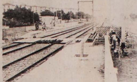
Não há passarelas na linha: um senhor já morreu eletrocutado.