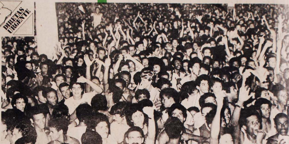
O comício-show, dia 5, foi o primeiro a atingir a casa de dezenas de milhares, inaugurando uma série que deverá prolongar-se pelas próximas semanas e por várias cidades.