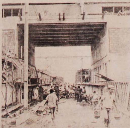
Inúmeros operários sofreram acidentes devido à falta de segurança na linha.