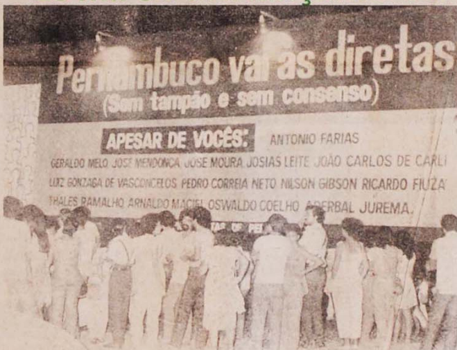
Na praça do Varadouro, expostos à execução pública, o nome dos parlamentares contra as diretas.

Um show da cantora Fafá de Belém no Lardo do Mosteiro de São Bento em Olinda, dia 5, reuniu mais de 20 mil pessoas para deflagrar a campanha pelas eleições diretas em Pernambuco. No sábado, dia 7, na tradicional Praça do Varadouro, também em Olinda, cerca de mil pessoas participaram da inauguração de um grande painel em defesa das diretas.