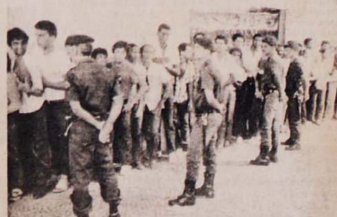
Filas de trabalhadores à procura de trabalho: cena comum nas capitais.