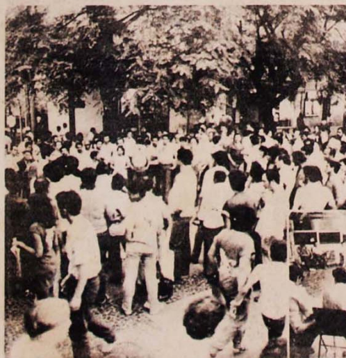
A fundação do Comitê-Centro de São Paulo e a convocação na Praça da Sé, que se repete todo dia.

Em São Paulo, a cada dia descortinam-se novas e imensas perspectivas de mobilização popular para o comício-monstro de 25 de janeiro por eleições presidenciais diretas. Esta semana começaram a surgir os comitês por região, na Freguesia do Ó, Zona Sul e Centro da Capital paulista, engajando várias dezenas de entidades na convocação em cada área.