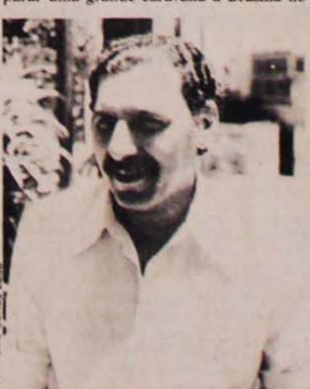
Jamil: "unir na luta contra o inimigo comum".

O Conselho Nacional das Classes Trabalhadoras (Conclat) realizou no dia 10 uma reunião das entidades sindicais da capital paulista, com a participação de 10 Federações e 23 Sindicatos. Nela ficou decidido que serão confeccionados 1 milhão de panfletos e que cada entidade deverá distribuir boletins próprios e realizar comícios para suas categorias. A coordenação estadual do Conclat também enviou circulares às entidades do interior recomendando que participem dos comícios pelas diretas das suas cidades e preparem caravanas para o dia 25. Todas as entidades presentes se dispuseram a preparar uma grande caravana a Brasília no