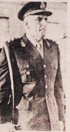
General Bignone, agora na cadeia.

De lá para cá, a pressão popular encabeçada pelas "Mães da Praça de Maio" fez o novo Presidente rasgar a lei de auto-anistia proclamada pelos militares em