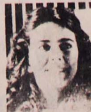
Mário Gomes e Maitê Pronci: desencontros conjugal.