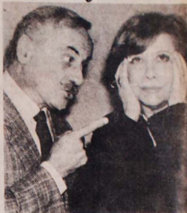
Paulo Autran e Fernanda Montenegro: humor com gabarito.

Terminou no dia 6 a novela "Guerra dos Sexos", da Rede Globo. Atraiu, durante 185 capítulos, a 57 milhões de pessoas em torno dos problemas da relação homem-mulher. Foi revolucionária no gênero das novelas, segundo Tarcísio Meira, e salu do estilo dramalhã da telenovela.