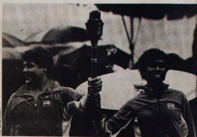
A tocha olímpica: objeto de comércio na terra do Tio Sam