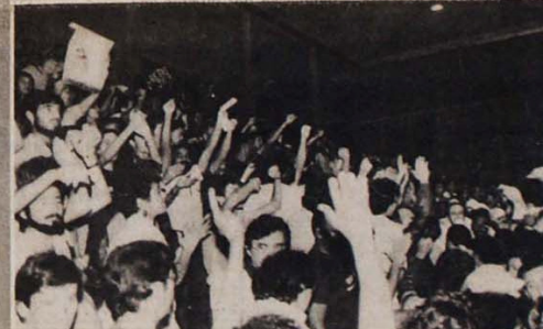
Operários comemoram a vitória, mas querem maior avanço no Sindicato.

No momento mesmo em que escrevemos estas linhas, na Zona Sul, onde atuamos, estouraram duas em Taiti. E em cima destas e de muitas outras lutas, pequenas e grandes, que estamos decididos a realizar nossa gestão à frente do Sindicato. E para levá-las à vitória que contamos com o apoio de todos os companheiros.