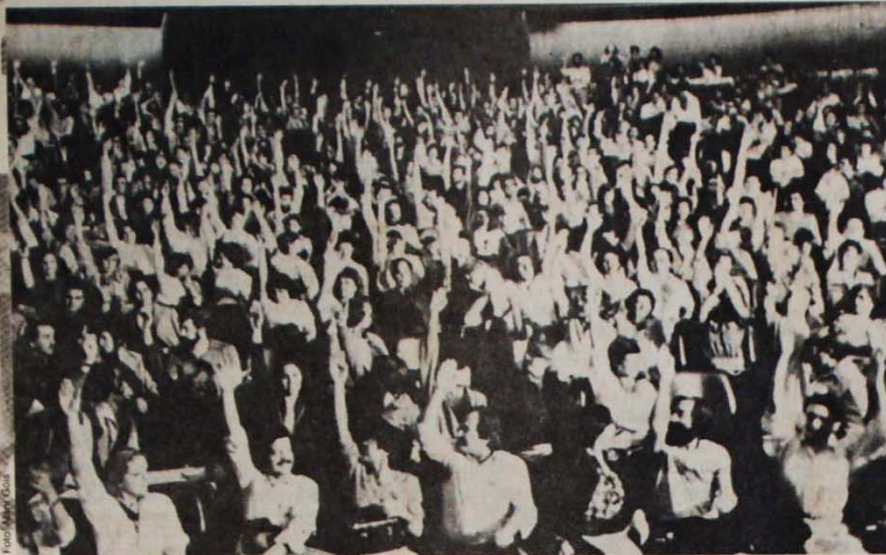
Assembleia de funcionários e servidores em Curitiba: em todas elas uma grande combatividade