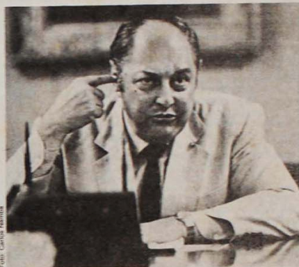
Aureliano, no jogo do poder, ficou contra o continuísmo

"O que está em jogo é o poder — não deve haver ilusões... O que estará em jogo em 15 de janeiro será a continuidade do status quo (vale dizer a oligarquia, a Coisa Nossa, os acordos criminosos que envolvem até mesmo homicídios ao amparo de pessoas acima de qualquer suspeita) e o regime da Lei..."