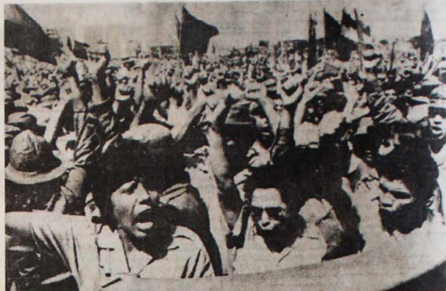
O povo foi às ruas saudar o quinto aniversário da Revolução Sandinista, em Managua

seados em sua experiência própria — e de toda a Europa — com o fascismo. Diante das dificuldades, os social-democratas cedem caminho para a direita e facilitam o avanço do fascismo. O antidoto contra este perigo só pode ser a mobilização energética dos trabalhadores e uma ampla frente única com todos os defensores da liberdade e da democracia.