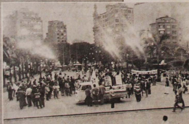
Na Praça da Sé, poucos ouvintes e algumas advertências