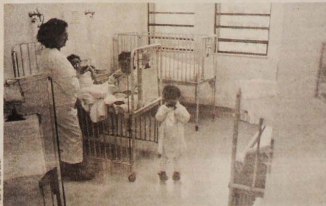
Mais de 600 crianças já foram internadas nos hospitais desde maio

extremamente contagiosa, causada por um vírus pertencente ao grupo dos Paramyxovírus, o sarampo atinge principalmente as crianças, durante o inverno. Os surtos são sazonais e ocorrem, em geral, de dois em dois