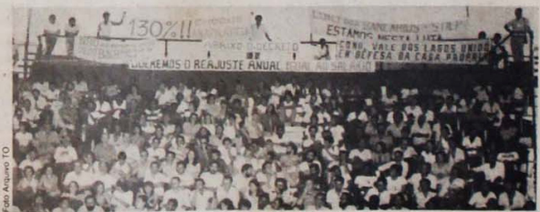
Mutuários organizam-se para defender o direito elementar de um teto para morar

De quebra este monstronismo transformou-se também numa fonte inesgotável de corrupção. Basta citar os escândalos da Delfin, da Haspa, da Coroa Brastel e vai por aí.