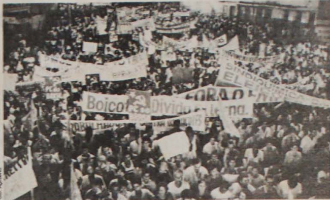
Candidato único terá de ir às ruas, com o povo e com bandeiras