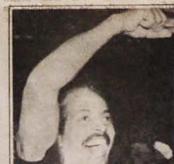
PONTO DE VISTA SINDICAL

Sabemos que nossa gestão não vai ser fácil. Quem analisa a situação do Brasil sabe que a crise deve-