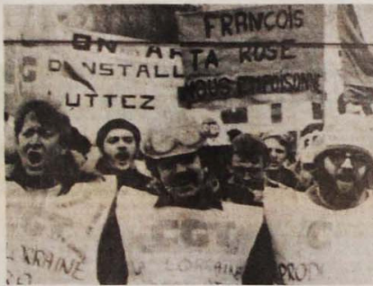
Operários lutam contra o desemprego na França social-democrata