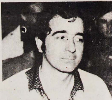
Freitas: "Realizar um encontro popular para discutir o programa mínimo"

Esta opinião é compartilhada por Mário Provenzi, presidente da Federação dos Trabalhadores na Alimentação: "Os trabalhadores não estão contentes com a divisão, querem que o movimento sindical marche unido. É bom ouvir os de baixo e deixar o cupulismo. Estamos perdendo muito com esta divisão, ficando imobilizados. Se tivéssemos um movimento sindical mais atuante, unido, a força do trabalho seria ouvida, os sindicalistas considerariam mais as expectativas