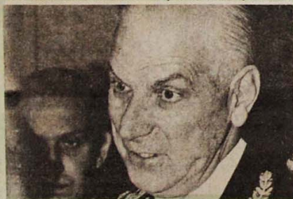
O general Bignone autorizava o assassinato dos prisioneiros.

"Pessoalmente creio que foi o reinado do demônio sobre a terra. Foram atos demôniosos os que se cometeram contra a imensa maioria de adolescentes, de jovens idealistas, parte da melhor juventude argentina, que foi seqüestrada diante de seus pais, encapuçada por aqueles que falavam de dignidade, de preservar os direitos e os princípios da sociedade civilizada. Peço aos homens e mulheres que estão me vendo, também às crianças, para que não se esqueçam nunca, que por favor, por amor à humanidade, nunca mais, nunca mais, possa acontecer na terra de homens como Belgrano e San Martín, uma atrocidade semelhante." (Ernesto Sabato, presidente da Comissão Nacional sobre Desaparecidos)