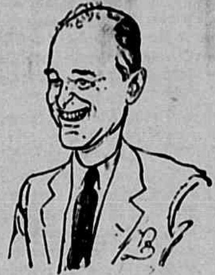
GEORGE F. KENNAN

ferindo na preparação de quadros, obrigando o uso de armamento de exclusiva fabricação norte-americana, etc. As forças armadas brasileiras, são, assim, praticamente submetidas ao comando dos generais ian-