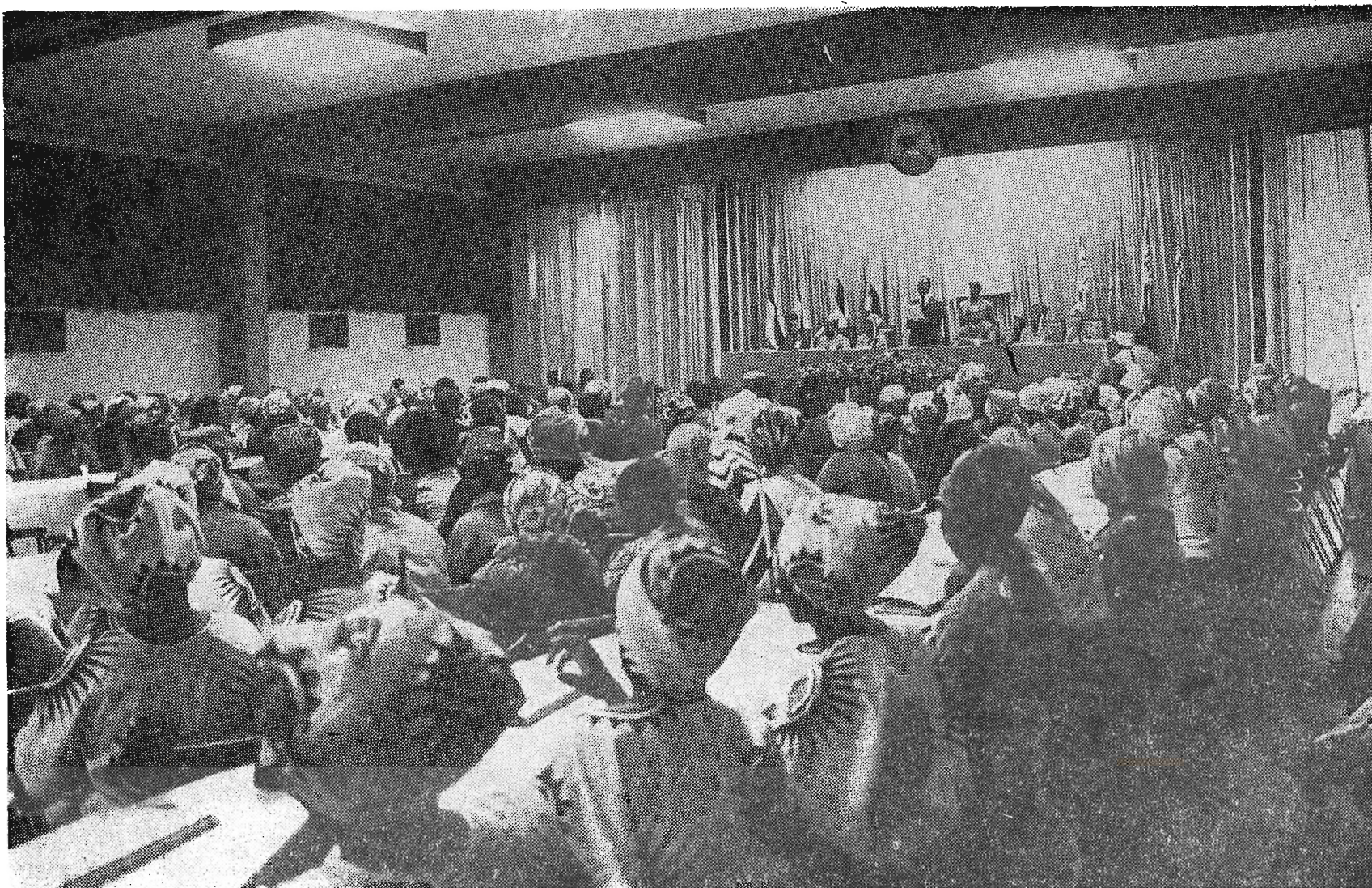
«A I Conferência teve por quadro Tunduru. A sala era modesta, a chuva torrencial fustigava-nos, alojámo-nos em palhotas. Muitas delegadas marcharam longos e difíceis dias, vencendo bombas e encharcadas, para darem a sua contribuição. É bom lembrarmo-nos desta diferença de cenários, para medirmos o caminho realizado e o preço de sangue pago pelo nosso Povo, para sermos hoje o que somos» — Camarada Samora Machel no acto da abertura da II Conferência da O. M. M.